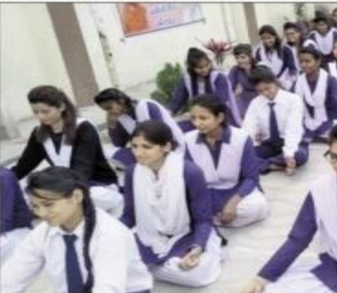
शिविर में योग अरुण का अ

महाविद्यालय परिसर में आयोजित योग शिविर का शुभारंभ महाविद्यालय के कैरियर काउंसिलिंग सेल के संयोजक डा.